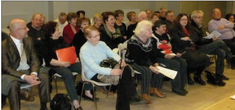
Les adhérents lors de l'assemblée générale.

Habiter au Bief-du-Moulin, qui vient de réunir ses membres, a à cœur le bien-être des résidents du quartier. Pour cela, elle propose divers rendez-vous et sait se renouveler et innover.