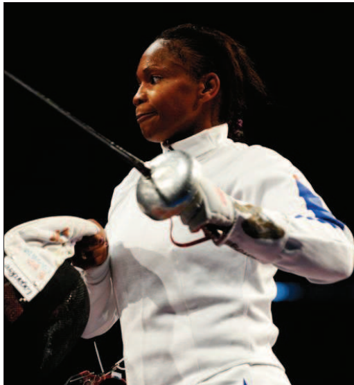
Il pourrait s'agir de ses derniers mondiaux.

Sa chance, c'est que l'épée sa s'ouvrir aux dames et même devenir olympique. Laura se sent plus à l'aise dans cette arme d'instinct, à la