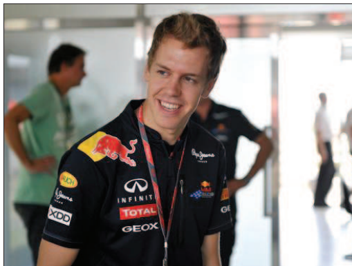
La victoire lui avait filé entre les doigts dans les derniers tours l'an dernier. Cette fois, le tout nouveau double champion du monde espère un autre final.