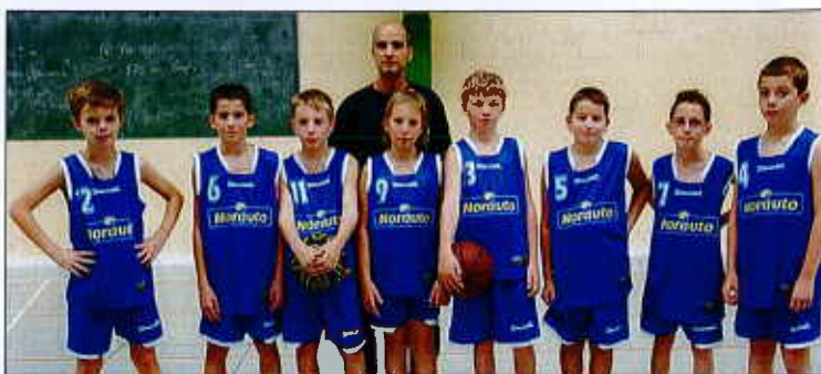
Les poussins 1 de l'ASC basket ont encore écrasé leur adversaire.

Après deux succès probants face à Auxonne (100-6) et à la JDA (6-91), les poussins 1 de l'ASC basket affrontaient, samedi dernier, à domicile, leurs homologues de Genlis dans la poule de brassage pour l'accès à la 1 re série de leur championnat.