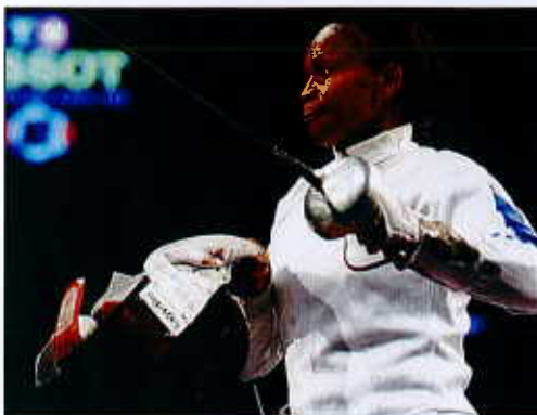
Laura Flessel espère briller de mille feux dans le cadre majestueux du Grand Palais.