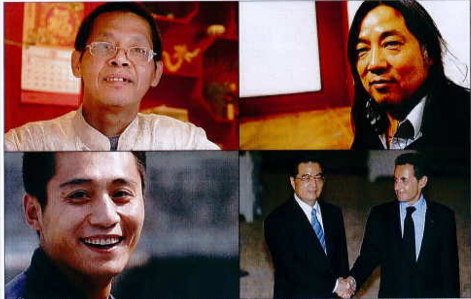
Qu'il s'agisse d'économie, de culture, de gastronomie, d'éducation, les liens entre notre département et la Chine sont nombreux. Le point à l'occasion de la visite du président chinois Hu Jintao en France. PAGES 2,3 ET 17